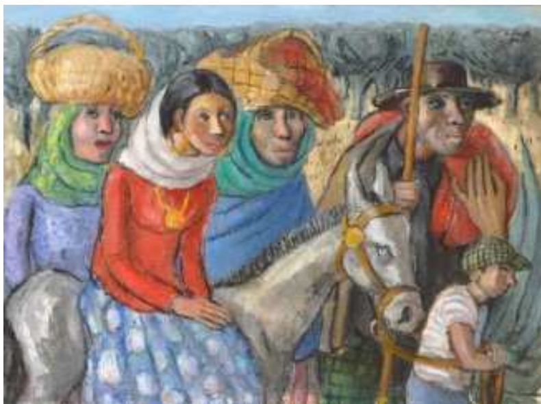
Ciganos , 1974 Arlindo Vicente (1906-1977) Óleo s/ Tela / Oil Painting 1026x940 Neo-realismo / Neo-realism Inv. N.º 808